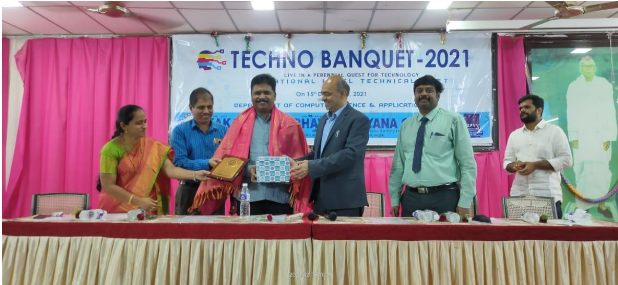
Felicitating the Guest