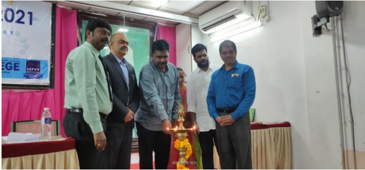
Lighting of the lamp