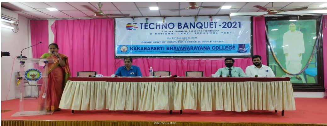
Vote of Thanks