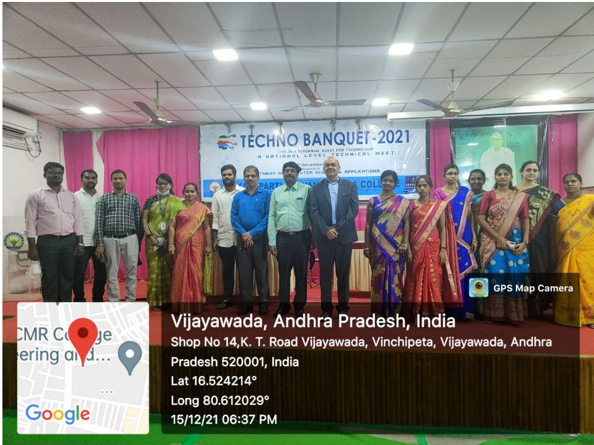
With Team Techno Banquet-2021